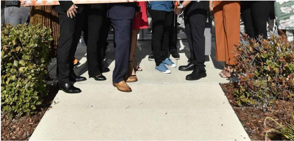
Corte de cinta durante la apertura del segundo establecimiento de FL Bakery.

“Ya queríamos retirarnos tras seis años trabajando en la panadería y por eso decidimos venderla a otro puertorriqueño que resaltará nuestros valores boricuas y el nombre de nuestro país”, dijo el hombre natural de pueblo de Ciales, un municipio de la región montañosa de Puerto Rico.