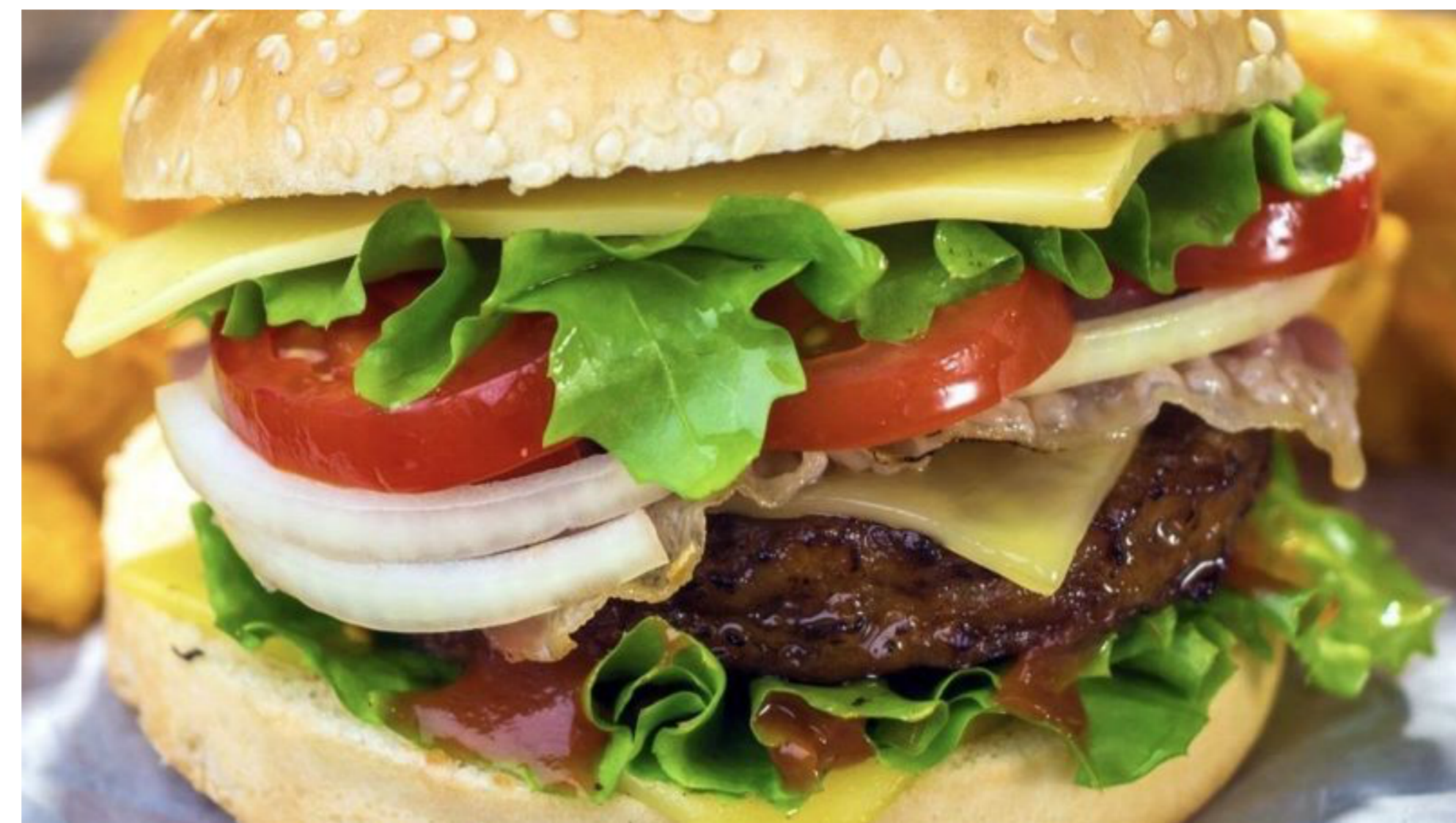
Los productos de Borges Meat serán distribuidos por Titan Products of Puerto Rico, con sede en Orlando.

La empresa familiar cría su propio ganado en varias granjas en Puerto Rico y lo exportan a Florida.